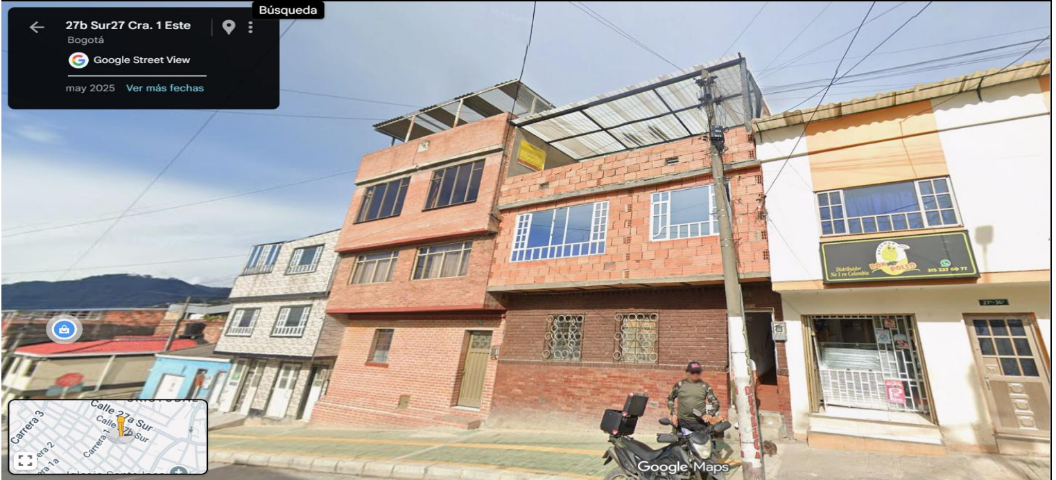
IMAGEN 1: NOMENCLATURA