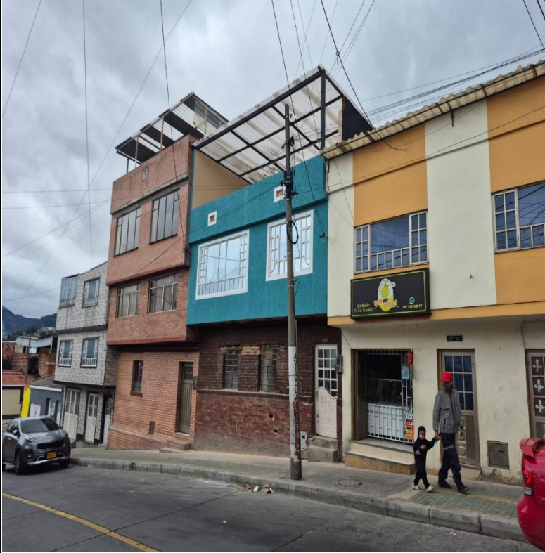
IMAGEN 3: FACHADA LATERAL